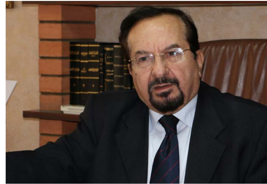
الوزير السابق عصام نعمان.