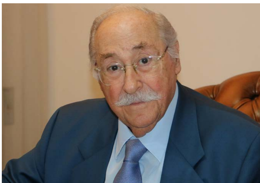
الوزير السابق الياس سابا.

■ ينصب الهجوم اليوم على هذه الطبقة التي التقت منذ سنوات تحت عنوان حكومات الوحدة الوطنية؟ □ في اوائل التسعينات لم تكن هناك