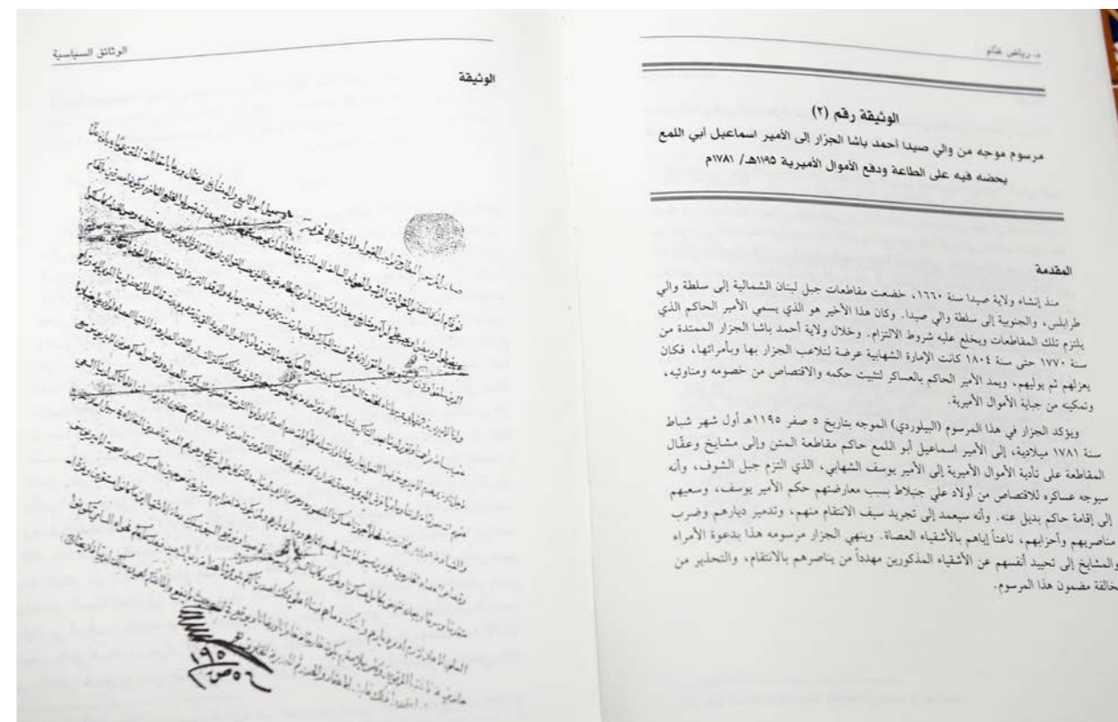
احدى وثائق الكتاب.

ولا تعطيتها، ولا تسمح بالحصول عليها. من المؤسف ان بعضهم يحتفظ بها ويعرف قيمتها ثم يأتي الورثة ويرمونها. ليس المطلوب من الباحث الحصول على الوثيقة الاساسية، بل صورها ويحصل على مضمونها. ثمة وثائق تعرضت للحرق والضياع.