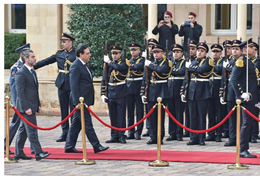
وصول رئيس الحكومة الى السرايا في اليوم الاول.

وزير البيئة والتنمية الادارية دميانوس قطار هو العضو الوحيد في الحكومة الذي سبق له ان دخل عالم الوزارة شأن رئيسها، بينما الوزراء الـ18 الاخرون كانوا من الاسماء المغمورة وان كان بعضهم يعملون كمستشارين في وزارات لم تخرج من ايدي احزاب معروفة طوال العقد الاخير.