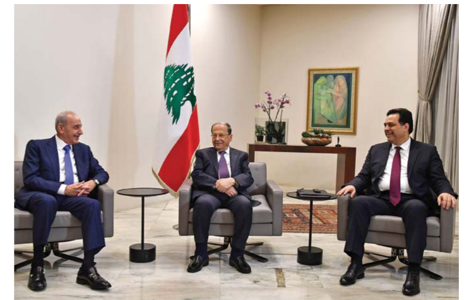
اجتماع رئيس الجمهورية ميشال عون ورئيس مجلس النواب نبيه بري ورئيس الحكومة حسان دياب قبل صدور مراسيم تأليف الحكومة الجديدة.

تنتظر الحكومة الجديدة برئاسة الدكتور حسان دياب جملة من التحديات المعيشية والاقتصادية في ظل مطالبتها بالرد على هواجس الحراك في الشارع. المجتمع الدولي يدعوها الى تحقيق رزمة من الاصلاحات، وتطبيق الشفافية بالافعال وليس بالاقوال، لتحصل على المساعدات المالية كي يتمكن لبنان من النهوض والخروج من الازمات التي تهدده على اكثر من مستوى