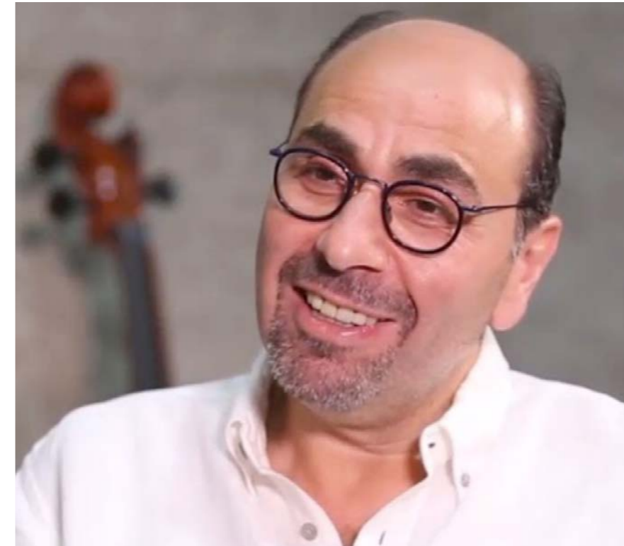
المؤلف الموسيقي اسامة الرحباني.

"انا حيث انام تستيقظ الاحلام، وانا الان نائمكم". بعد 13 عاماً على رحيل منصور الرحباني نشعر بحضوره معنا اكثر من اي وقت مضى. هو الذي استشرّف مستقبلنا وحدثنا عنه بالشعر والموسيقى والمسرح. وقع رحيله الهادئ جاء مدويا والفراغ الذي خلفه يتسع يوماً بعد يوم. فهل فعلاً يرحل العظماء ام انهم فقط ينامون ليقظوا الاحلام فينا؟