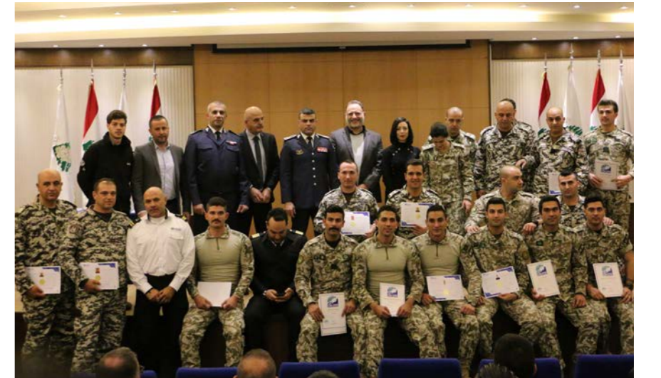
المتخرجون في الدورة.