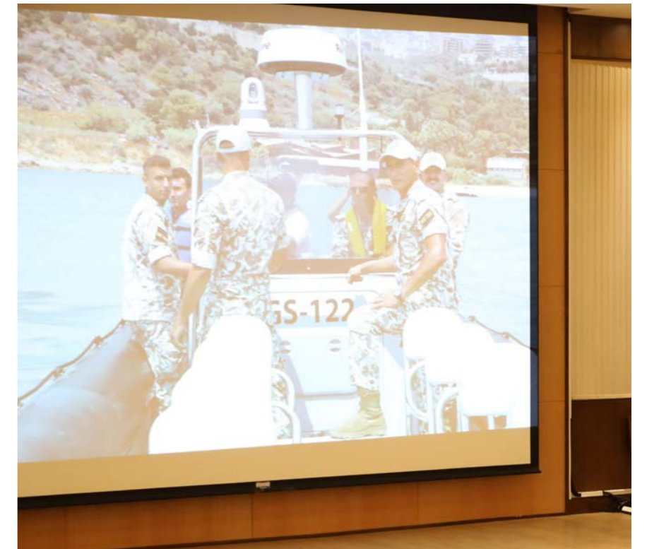
من عرض عن الزوارق.