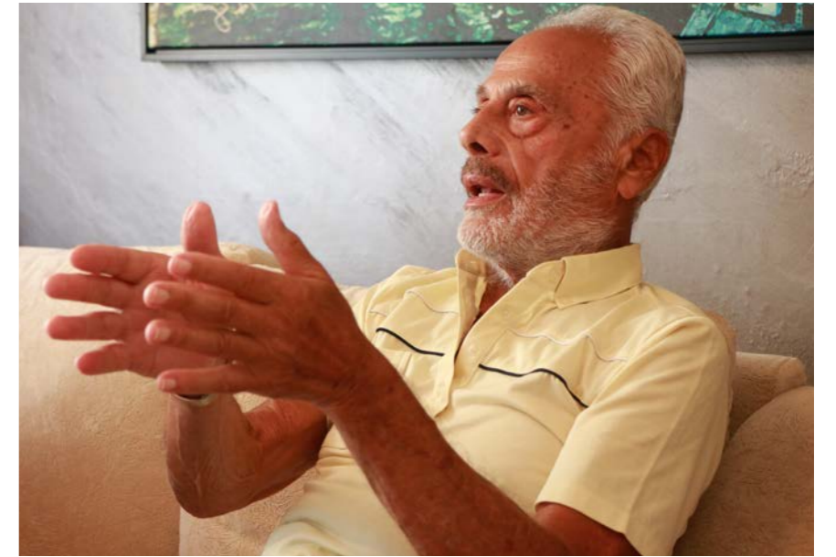
الممثل يوسف فخري.

لم يتسن للممثل يوسف فخري المعروف بشخصية كوكو لعب ادوار رئيسية بل ثانوية. كان مضطرا الى القبول بها بسبب وضعه المادي. معاناته هذه دفعته الى جعل من كل دور ثانوي، باضافات من ذاته، شخصية لافتة للنظر بين ادوار رئيسية كثيرة، فلمع في دور الشاب كوكو الذي احبه الناس بسبب عفويته