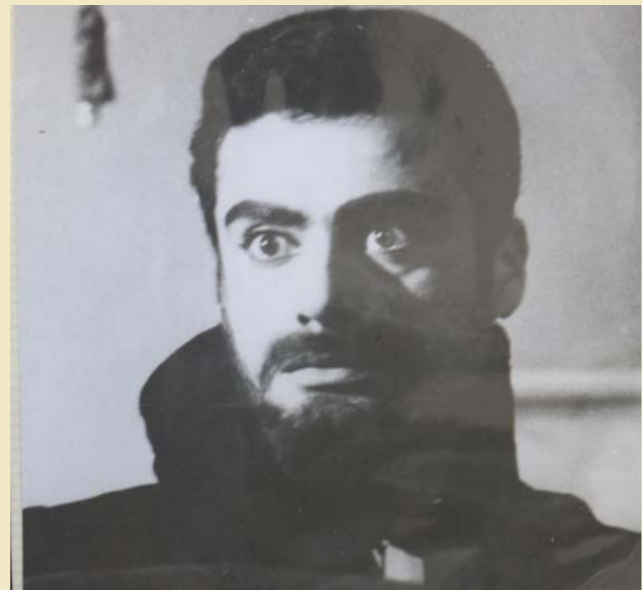
في دور الساحر.