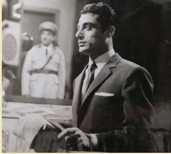
من برنامج "حكمت المحكمة".