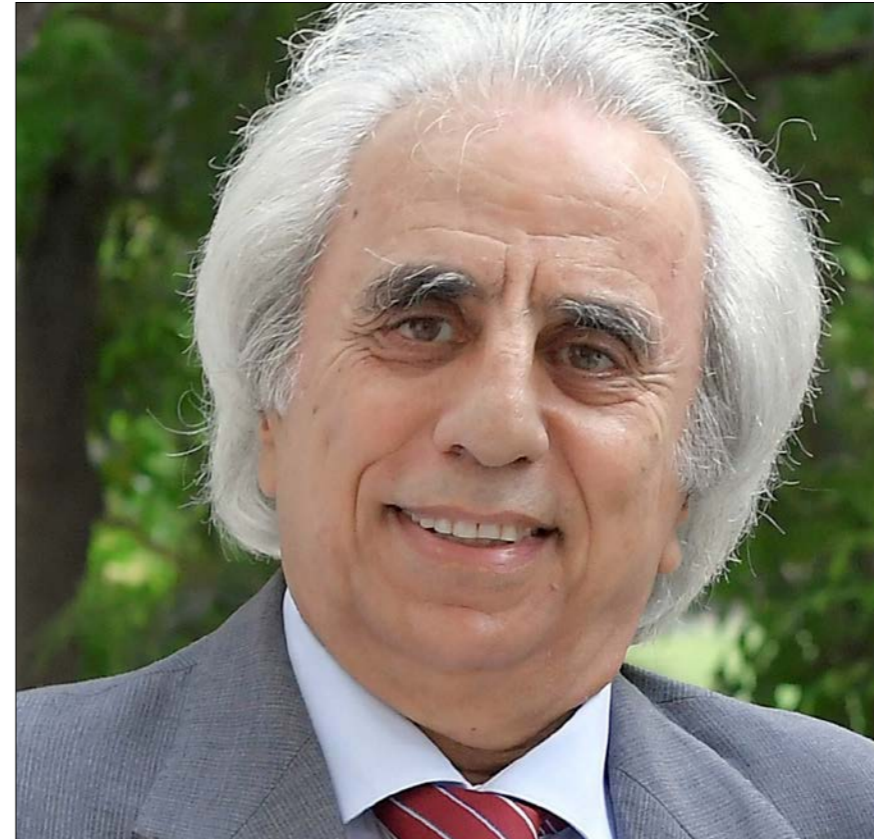
الشاعر هنري زغيب.

لطالما كانت المرأة المصدر الاول للالهام الشعري، ولكل قيم ومعاني الجمال والخير والحب والفضيلة منذ فجر الانسانية، كما هي الشاعرة التي يتميز نتاجها الشعري بقوة الوجدان وغنى العاطفة، وبالتالي الاكثر تأثيرا في المتلقي. وهي اول من نظم الشعر، وفق دراسات كشفت عن اقدم كتابة موثقة تعود الى 3400 سنة قبل الميلاد في سومر