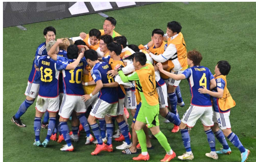
لاعبو المنتخب الياباني يحتفلون بتسجيل الإصابة الثانية في المرمى الالماني.

اما احداث التقنيات المعتمدة في كأس عالم قطر 2022 فهي تقنية شبه الية للكشف عن حالات التسلل. اذ تم اطلاق تقنية "الحكم الروبوت" خلال بحسب ما اعلن الفيفا، بعد ظهورها في