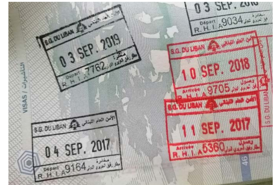
المعايير التقنية والامنية في الوثائق البيومترية اللبنانية تفوق باشواط التي تنصح بها المنظمة الدولية للطيران المدني.

شبه دائمة، اضافة الى الحروب الكثيرة التي شهدتها لبنان خلال السنوات العشر الاخيرة، سواء في الداخل او في مواجهة العدو الاسرائيلي. كذلك التصاق حدوده بحدود الدولة السورية التي شهدت وتشهد في الفترة الاخيرة حروبا شرسة مع منظمات اراهابية، تمددت الى لبنان كما الى مختلف دول العالم، اصف الى ذلك ضعف القدرات الاقتصادية للدولة اللبنانية وسواها، كلها عوامل كانت تقف حائلا دون اجراء اتفاقات دبلوماسية بين الدولة اللبنانية وبين دول اخرى تتيح الغاء تأشيرات الدخول المسبقة بينها وبين لبنان. يبقى السؤال الاهم: كيف يمكن تصنيف جواز السفر اللبناني البيومتري، تقنيا وامنيا، مقارنة بجوازات السفر المعتمدة حاليا في العالم؟