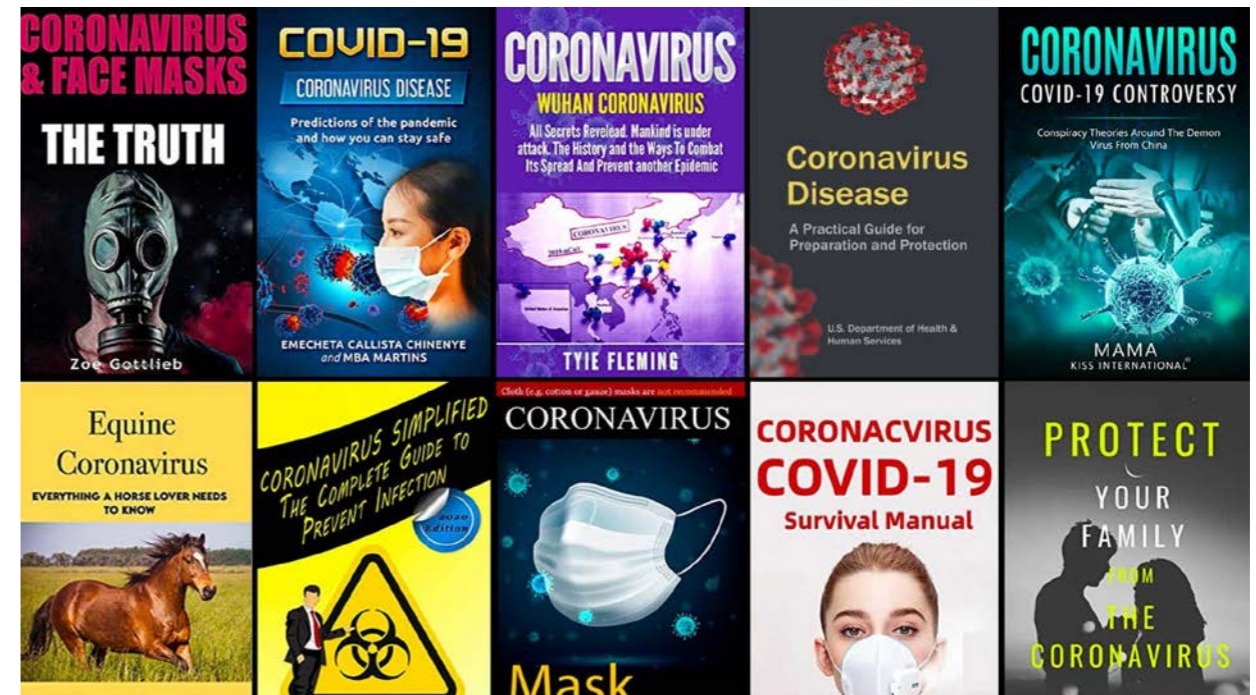
اصدارات حول الوباء.

وستبحث الدراسة على مستوى بريطانيا عن جينات وراثية محددة ربما تساهم في تدهور حالة المريض ستشمل 20 الف شخص، في محاولة كما يقول طبيب العناية المركزة الذي يقود الدراسة في جامعة ادنبره كينيث بيبي لكشف مؤشرات ستظهر في الشريط الوراثي وستساعدنا على فهم كيف يقتل هذا المرض مصابين: اراهن على ان هناك مكوّنا جينيا قويا يتعلق بمدى خطورة المرض على المرء.