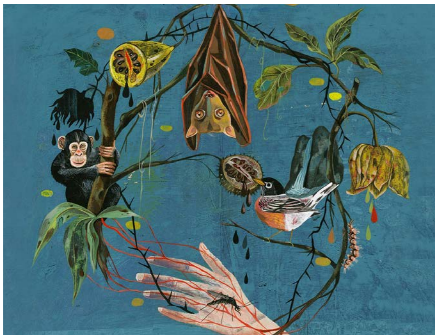
رسم للطبيعة وكورونا.

هناك حاليا اكثر من 100 مشروع في العالم واكثر من 10 تجارب سريرية للقاح، بينها 5 في الصين، لمحاولة ايجاد علاج لكورونا المستجد. بينما تقول وكالة الادوية الاوروبية ان توفر اللقاح قد تتم الموافقة عليه في اكثر السيناريوهات تقاؤلا مطلع عام 2021، يقول الرئيس الاميركي دونالد ترامب انه يتوقع الوصول للقاح في نهاية عام 2020، وان ادارته ستستثمر في افضل اللقاحات المرشحة لعلاج الفيروس، موضحا انه جرى اعداد قائمة تضم 14 لقاحا واعدا مع امكان تقليصها. يحاول العديد من مراكز الابحاث حول العالم استخدام بلازما دماء المتعافين من الفيروس كعلاج. وبحسب هيئة الاذاعة البريطانية، فمة 3 مقاربات للعمل على انتاج علاجات للوباء يجري اختبارها على نطاق واسع: - الادوية المضادة للفيروسات التي تؤثر بشكل مباشر على قدرة فيروس كورونا على النمو داخل الجسم. - الادوية التي في امكانها تهدئة جهاز المناعة، اذ تصبح حالة المصاب بالفيروس خطيرة عندما يستجيب نظام المناعة لديه بشكل مبالغ فيه ويبدأ في التسبب بحصول اضرار جانبية للجسم. حتى الان، يبدو ان العلاج الوحيد الذي اعطى اشارات على فاعليته في مواجهة المرض، هو عقار ريميسيفير الذي صمم اساسا لعلاج مرض ايبولا. تتعاون الوكالة الاوروبية مع 33 خيرا لتطوير علاج للفيروس وتختبر نحو 115 علاجا ممكنا، ولا تعرف ايا منها قد يكون جاهزا في الاجال المحددة.