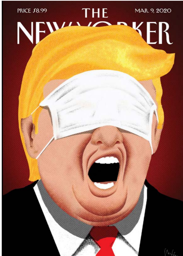
غلاف مجلة "نيويورك" يسخر من الرئيس الاميركي دونالد ترامب.