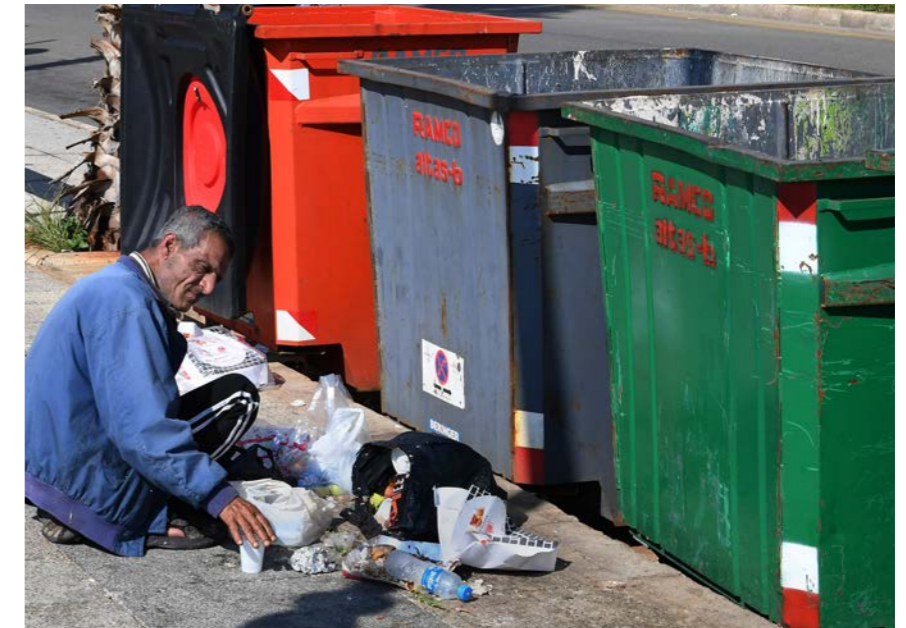
اعلى مستويات الفقر تسود في منطقتي الشمال والبقاع.

■ ماذا تعني المطالبة بتشديد رقابة مجلس النواب على تنفيذ القرض ومتابعته، واين تقع المشكلة؟ □ تتمثل اولوية البنك الدولي في توفير المساعدة الطارئة للاسر الاكثر فقرا، وذلك مع الالتزام التام بسياسات البنك والمتطلبات الائتمانية لضمان الشفافية الكاملة في اثناء التنفيذ. كذلك ستكون هناك مراقبة مستقلة للبرنامج باكملة.