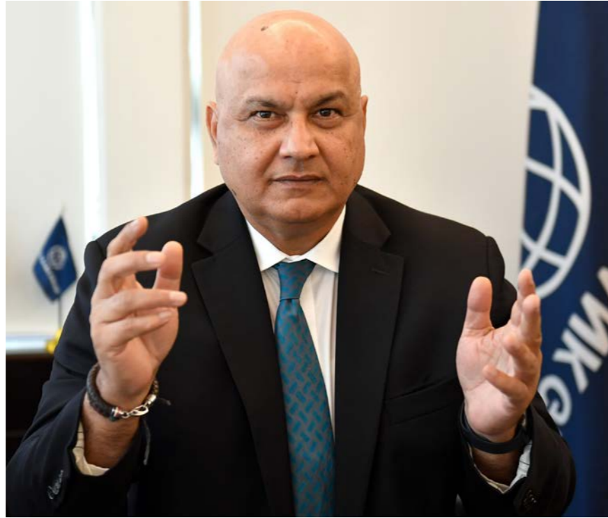
المدير الاقليمي لدائرة المشرق في البنك الدولي ساروج كومار جها.

□ المشروع الطارئ لدعم شبكة الامان الاجتماعي لاستجابة الازمة وجائحة كوفيد - 19 في لبنان (مشروع شبكة الامان الاجتماعي)، هو مشروع مدته ثلاث سنوات وكلفته 246 مليون دولار. يهدف الى تقديم تحويلات نقدية وتيسير الحصول على الخدمات الاجتماعية للبنانيين الفقراء الازحين تحت خط الفقر المدقع والمهمشين، الذين تأثروا بالازمة الاقتصادية وجائحة كوفيد - 19. يرمي المشروع الى وقف الزيادة في معدلات الفقر المدقع، والحفاظ على رأس المال البشري للاطفال الذين تتراوح اعمارهم بين 13 و18 عاما الملحقين بالمدارس الحكومية، وذلك من خلال تقديم تحويلات نقدية وتيسير الحصول على الخدمات الاجتماعية. كما يسعى الى بناء منظومة وطنية مستدامة لشبكات الامان الاجتماعي في لبنان. سيعمل المشروع على توسيع مظلة البرنامج الوطني للحكومة اللبنانية لدعم الاسر الاكثر فقرا وتعزيزه. برنامج المساعدات