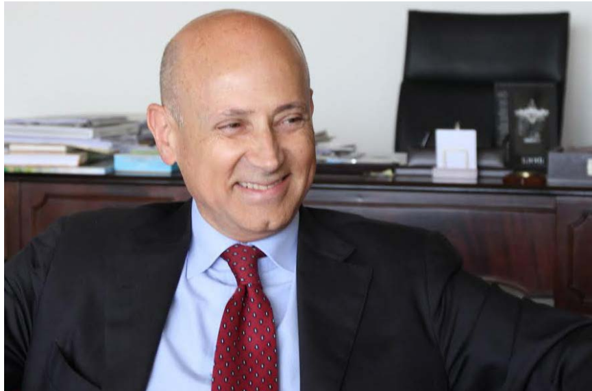
السفير الإيطالي في لبنان ماسيمو ماروتي.

■ لماذا اخترتم لبنان تحديدا لتنفيذ هذا المشروع؟ □ تهدف هذه المبادرة الى وضع لبنان على الخارطة العالمية للسياحة الدينية، وتعزيز المواقع الدينية ذات الهمية الثقافية. قمنا بتطوير السياحة الدينية في إيطاليا، ونحن شريك طبيعي للبنان في هذا الخصوص ونولي هذا المشروع اهمية كبيرة، اذ من شأنه تأمين الدخل للمجتمعات المحلية بفضل تطوير البنى التحتية وفرص العمل المتأتية من النشاط السياحي كالمطاعم والفنادق، واحياء المهن الحرفية والمشاريع التجارية الصغيرة الحجم.