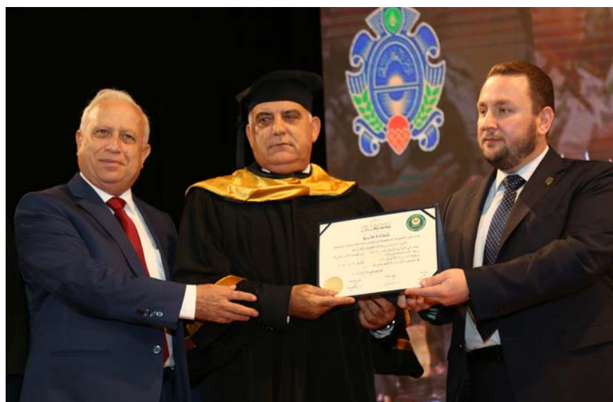
تقليد اللواء عباس ابراهيم الدكتوراه الفخرية.

وتابع: "اهنئكم اساتذة واهالي على تخريج هذه الكوكبة من الطالبات والطلاب الذين يشكلون حاجة وضرورة لمجتمعنا، لنبني معهم وطننا افضل واشد تماسكا. ليس لنا الا العلم بكل انواعه لمواجهة الجهالة والتناوب الذي ينبعث من غوغائين للايقاع بين اللبنانيين. المطلوب ان نؤمن بوطننا وقدرتنا التي ثبت انها تميزت في اصقاع العالم وفي شتى المجالات، حيث لنا مواطنون في جهات العالم الاربع يصنعون الانجازات ويراكمون النجاحات. اننا، في اجهزة الدولة، في ظل التفاعل الايجابي داخل المؤسسات الدستورية وخارجها، نعمل على تمتين حماية لبنان بما هي ثابتة سيادية لكل دولة حرة وقوية. لن يكون لنا ما نريده جميعا الا متى قفزنا فوق الواقع الرهيب الذي يفتعله البعض سعيا الى مجد على انقاض وطن، غير آبه بالمآلات الخطيرة لقطع التواصل، ومعنى التقوقع في شرنقات سياسية صغيرة. المطلوب منكم ايها الاكاديميون، بما تمتلكون من ملكات فكرية وذهنية بنيتها في صرح جامعة الجنان، ان تكونوا سدا في وجه كل محاولات التفرقة من اي جهة اتت، مهما كان اسمها او الثوب الذي تستر به. واجهوا الطائفية بايمانكم الصادق بوطنكم لبنان الرسالة. اسقطوا كل مشاريع الاساءة والتشويه لديتنا الحنيف، فالله العلي القدير يطلب منا الايمان، لا ادعاء التدين على غيرنا من البشر الذين خلقنا جميعا سواسية. كونوا مواطنين لا ديانين تكفرون هذا او ذلك. اللبنانيون محكومون بعيش ايمانهم ومواطنيتهم كرسالة، سوى ذلك لا يعني الا الخراب. وحدتنا جميعا صنعت نصرنا على اسرائيل. وحدتنا ذاتها هي التي منعت وجود اي بيئة حاضنة للارهاب، فكان النصر عليه في فجر الجرود".