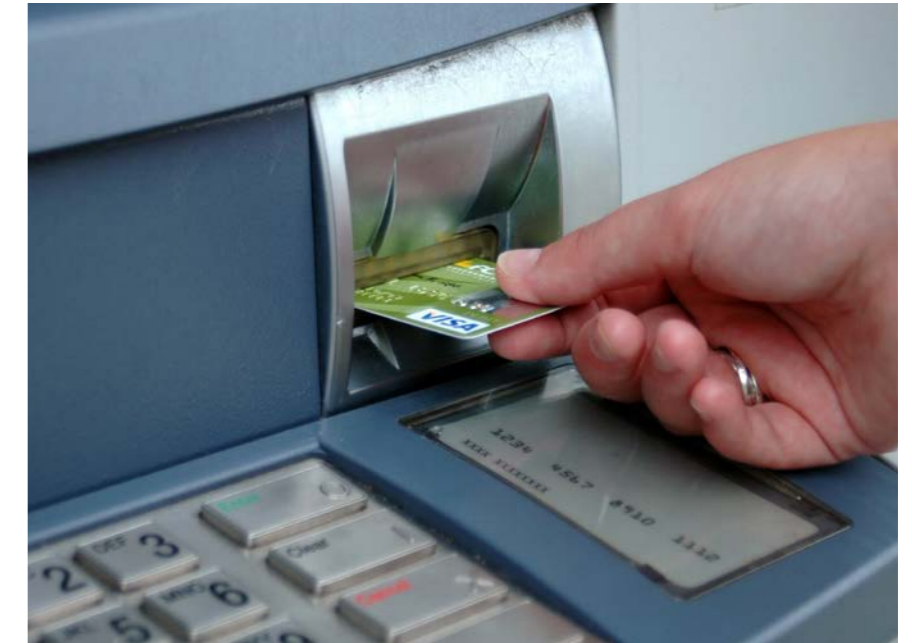
القطاع المصرفي احد ابرز ركائز الاقتصاد اللبناني.

عدة. ابرز صور تلك الجرائم الاحتيال والسرقة والاختلاس والابتزاز والتخريب والتجسس بالوسائل الالكترونية، وغيرها. من النماذج الواقعية للجرائم المالية الالكترونية التي قد تتعرض لها المصارف، نذكر على سبيل المثال واحدة من الحالات التي ضبطها اخيرا الامن العام واحال فاعليها على القضاء المختص. وهي تتلخص في قيام شخص مجهول الهوية (مقرصن) بالدخول غير المصرح به الى البريد الالكتروني لمدير تنفيذي في مصرف معين واستخدامه في مراسلة مدراء فروع تابعين للمصرف آمرا اياهم اجراء تحويلات مالية من حسابات محددة الى حساب آخر، هو في الواقع حساب يخص المقرصن الذي قام فور تحويل الاموال الى حسابه بسحبها.