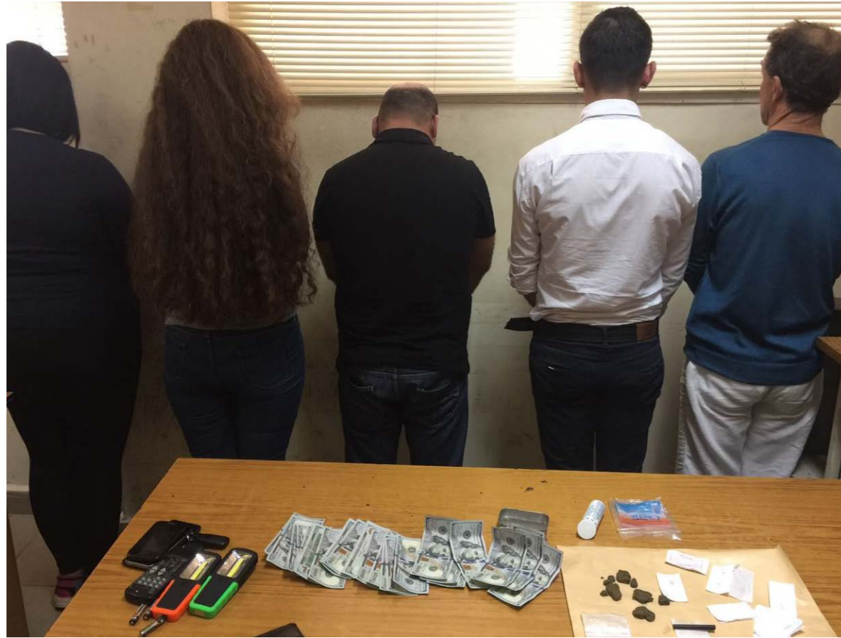
الشبكة المنظمة استخدمت مستندات حسابات مصرفية مزورة.

كانوا يستهدفون الحصول على أكثر من مليار دولار).