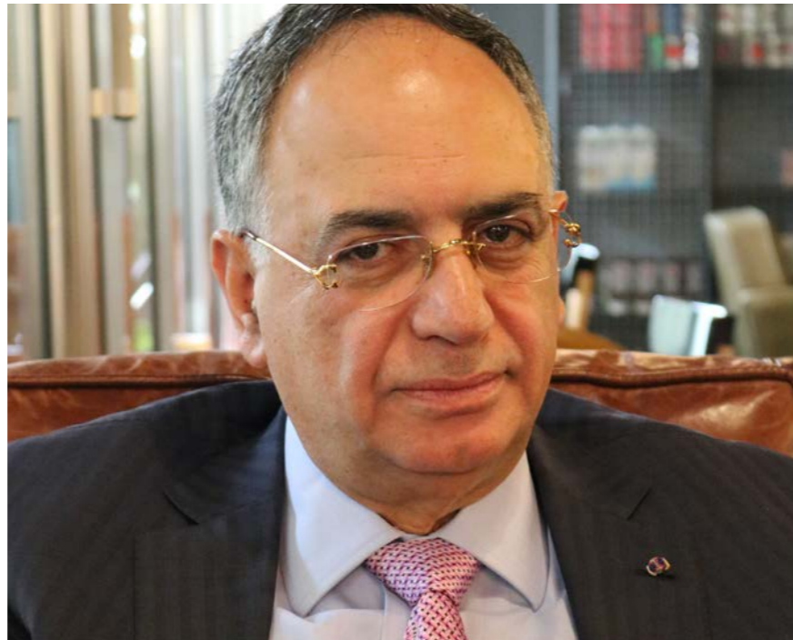
السفير شربل اسطفان.

وزارة الخارجية والمغتربين هي وحدها المخولة اصدار الجواز الديبلوماسي، ومنذ اعتماد الجواز البيومتري في 22 آب 2017، تقوم الوزارة باصداره بتعاون تقني مع مركز الامن العام الدائم فيها